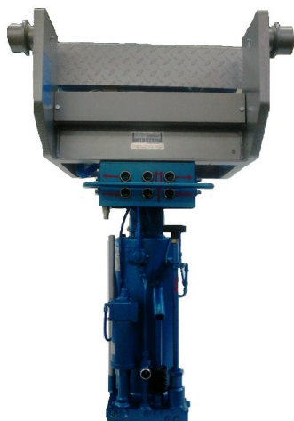
KH 15 LMZS –LFS mit AT 15 PN

Vollautomatischer Luftheber mit 3 t Tragkraft sowie Traverse für ferngesteuertes Heben und Senken des Hebers sowie Aus- und Einfahren der Traverse in und mittels Fernbedienung außerhalb der Grube.